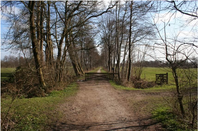
Coulisselandschap met houtwallen, typisch voor het Westerkwartier