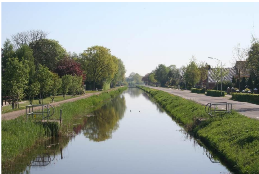
Blik op Jonkersvaart