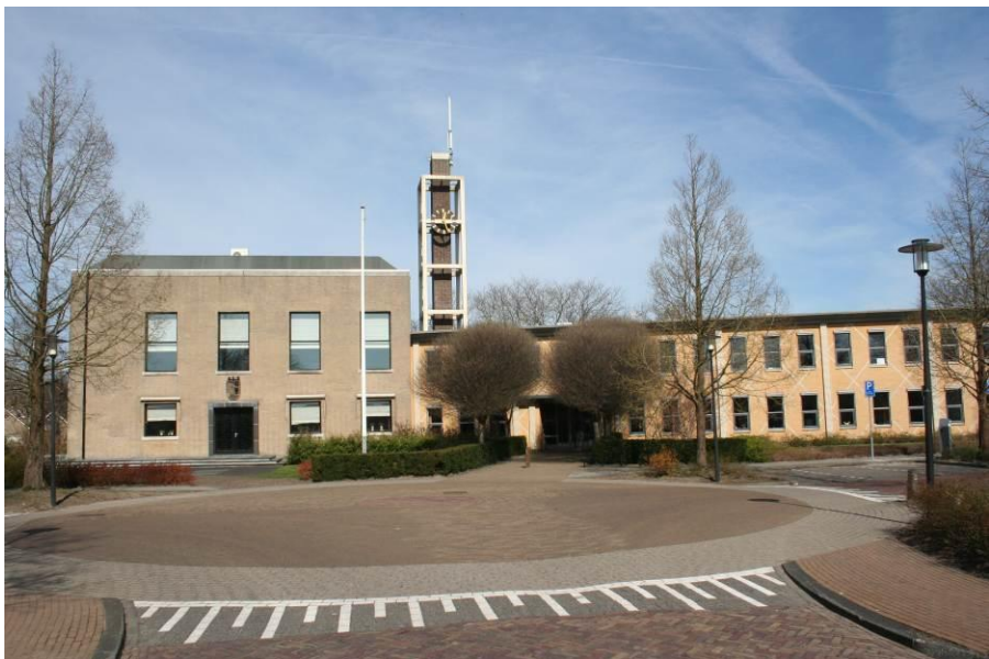
Gemeentehuis van de gemeente Marum

Ten noorden van het dorp, aan de andere kant van de rijksweg, ligt het bedrijventerrein Marumerlage dat een paar jaar geleden in gebruik is genomen.