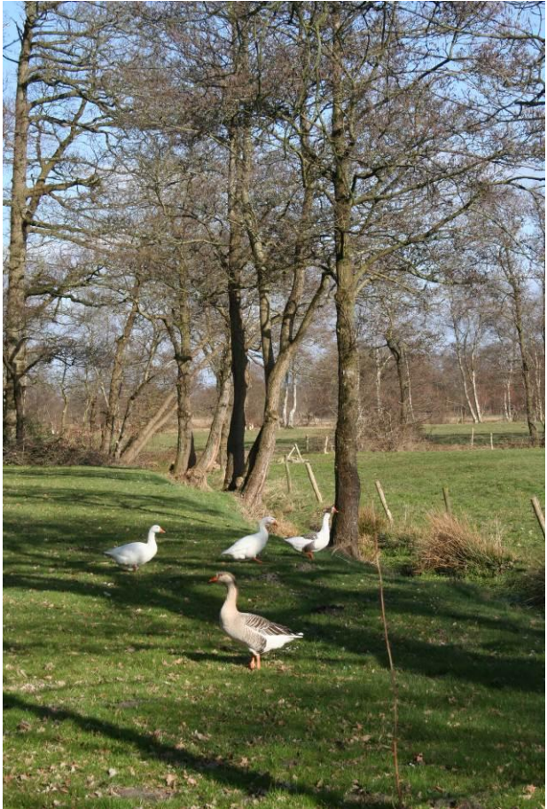
Wilde ganzen in het coulisselandschap